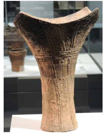
(写真:波状口縁深鉢/縄文時代前期:約7500年前/高さ36.5cm/茅野市尖石縄文考古館蔵)

換える…など遅きに失したとはいえ何かと微々たる行動を取っている、目指す目標(温暖化を止めるなど)は到底達成はできないだろうと知りつつも。そんな今、この目標達成に向けて最も必要とされることの一つは、幅広い分野の客観的・俯瞰的な科学的知見を集約・検討しつつ、より有効・抜本的政策を練り上げ、実行していくことではないだろうか。ともあれ、今この時期に、学術会議人事介入という反科学的大スキャンダルを演じて見せる政権に、果たしてこれからの私たちの運命を任せてよいのだろうか?折しも突然現れた未知のウィルスに世界中人々が襲われている現代という時代の意味を、あれこれ文献を前にして、優れた芸術(?)品を生み出した縄文の人々の生きた生活・自然環境に思いを馳せながら考えさせられている。私たちは地球上でしか生きていけないのだから。